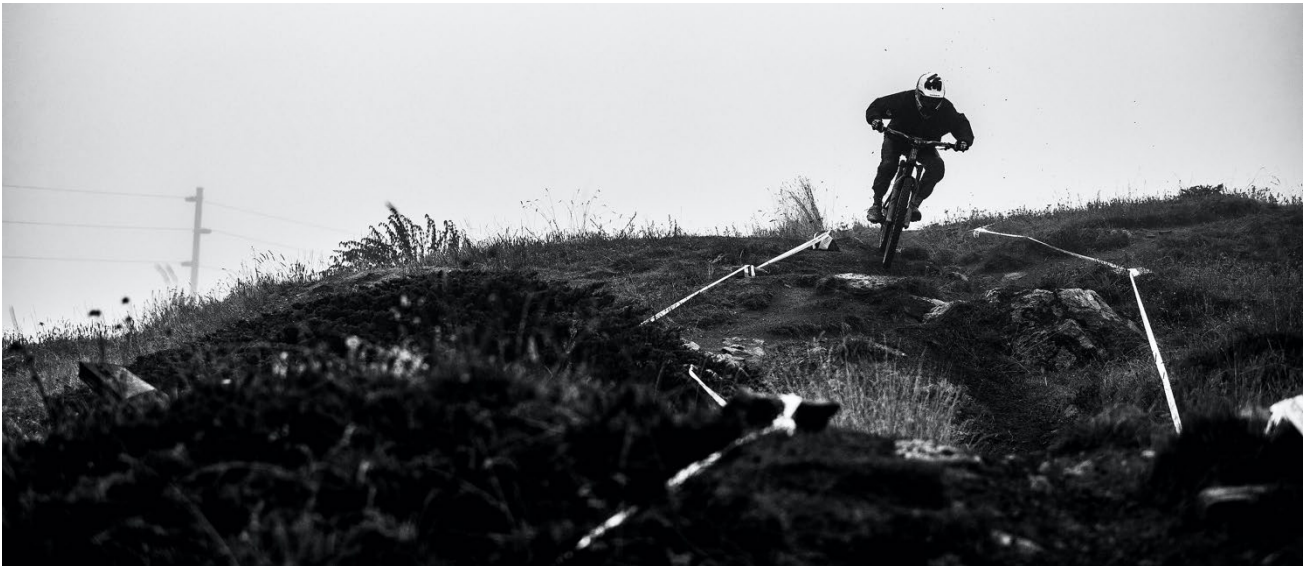
Figure 1 Tape auf beiden Seiten nahe am Boden windgeschützt

Wenn zwei Stücke Tape auf beiden Seiten des Trails angebracht sind, muss der Fahrer zwischen ihnen hindurchfahren. In diesen Bereichen wird das Überqueren oder das Umgehen des Tapes auf der anderen Seite als Abkürzung gewertet.